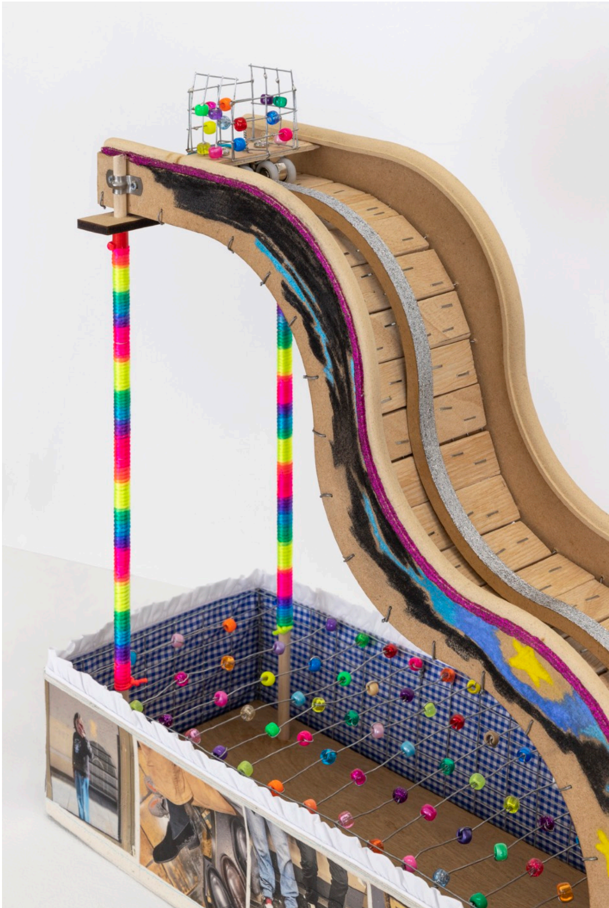
Guendalina Cerruti, Life is a Rollercoaster , 2023, bois, perles en plastique multicolores, treillis métallique, paillettes, colle, pastels, corde arc-en-ciel, transfert de photo sur toile, tissu, 73 x 20 x 55 cm.