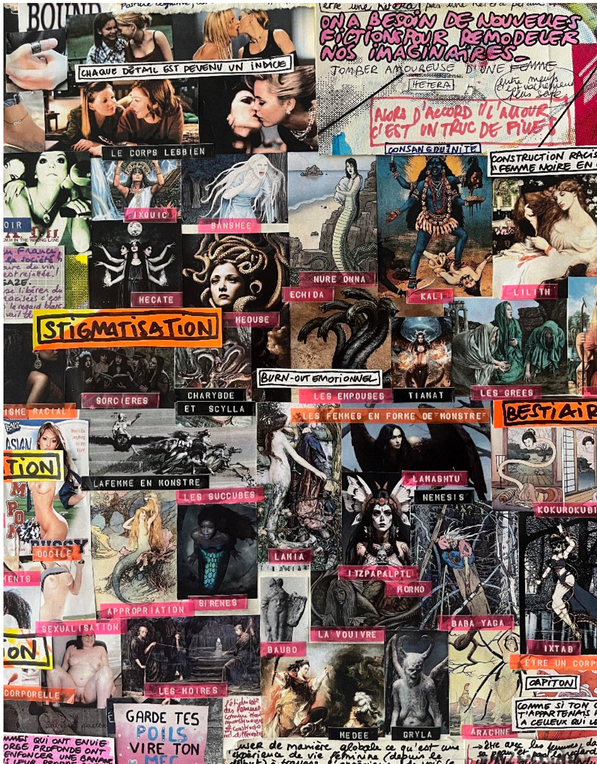
Marielle Chabal, Projet QUEENS, Moodboard #1, 2024 . Magazines Girls , août 1997 et septembre 1998, Jeune & Jolie , juillet 1999 et mai 2003, Vogue , juin 2010, carnets de notes, avril 2020 et mai/juin 2022, chutes de découpes d'affiches sérigraphiées du Programme OPP-OPS, catalogues La Redoute , printemps-été 2002, Pétromasculinité de Cara New Dagget, papiers imprimés, feutres à encres et à gel, colle chaude colorée, tracts militants Attac distribués par les Rosies d'Amiens, paillettes "rose barbie" Lash, plastique vinyle Jennifer, vernis à ongles Nars "My fuschia life", fil à coudre beige, rose pâle et lavande Hema, tâche de café Richard, assemblage de grains de zinc bio et de club Maté Loscher, tipp-ex bande mini, pastel sec extra tendre rose Colorado Schmincke, blush Bourgeois rose coup de foudre, ruban plastique étiqueté rose, orange, noir, transparent, bleu clair et foncé Hema, ayous naturel teinté, carton gris recyclé, 128,5 x 90 cm.