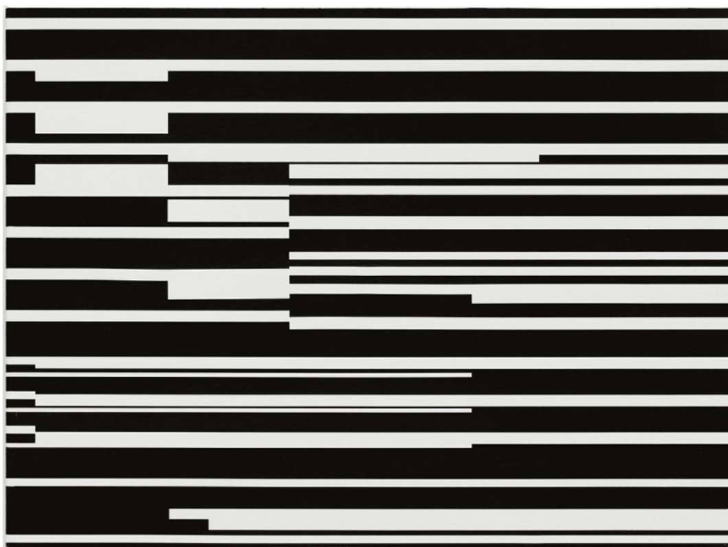
Esther Stocker, Sans titre , 2025 Acrylique sur toile, 60 x 80 cm, unique