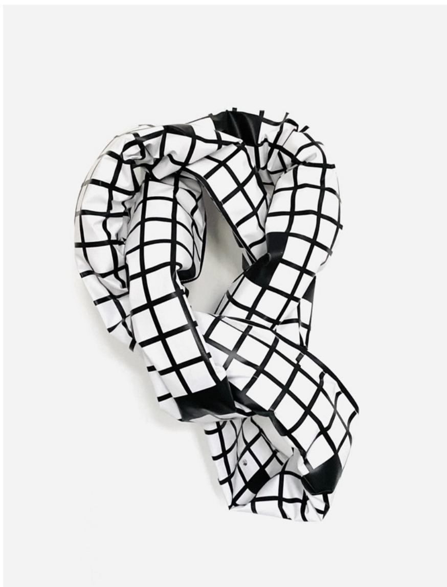
Esther Stocker, Sans titre , 2026 PVC imprimé, techniques mixtes, 60 x 80 cm, unique